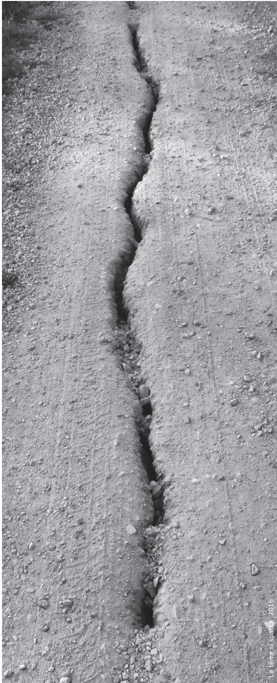
ph. Marco Mazzi 2015