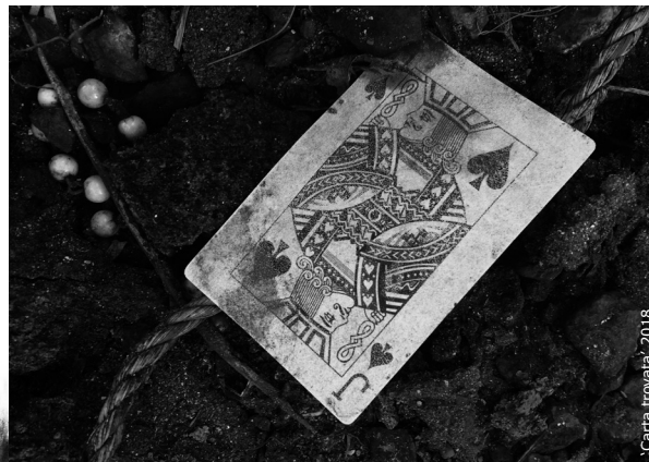
'Carta trovata' 2018