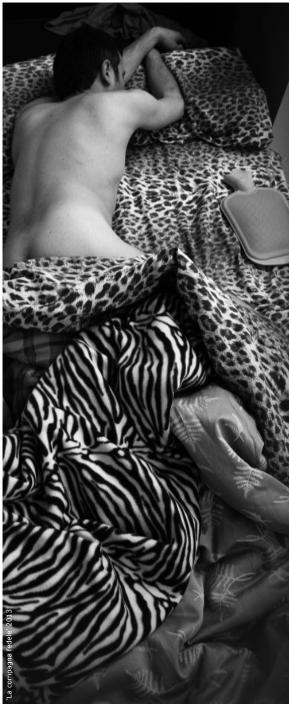
'La compagna fedele' 2013