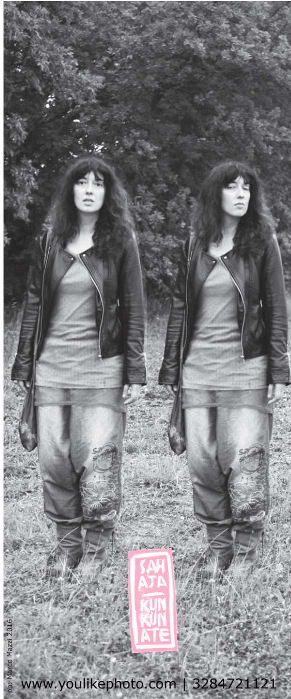
ph. Marco Mazzi 2016